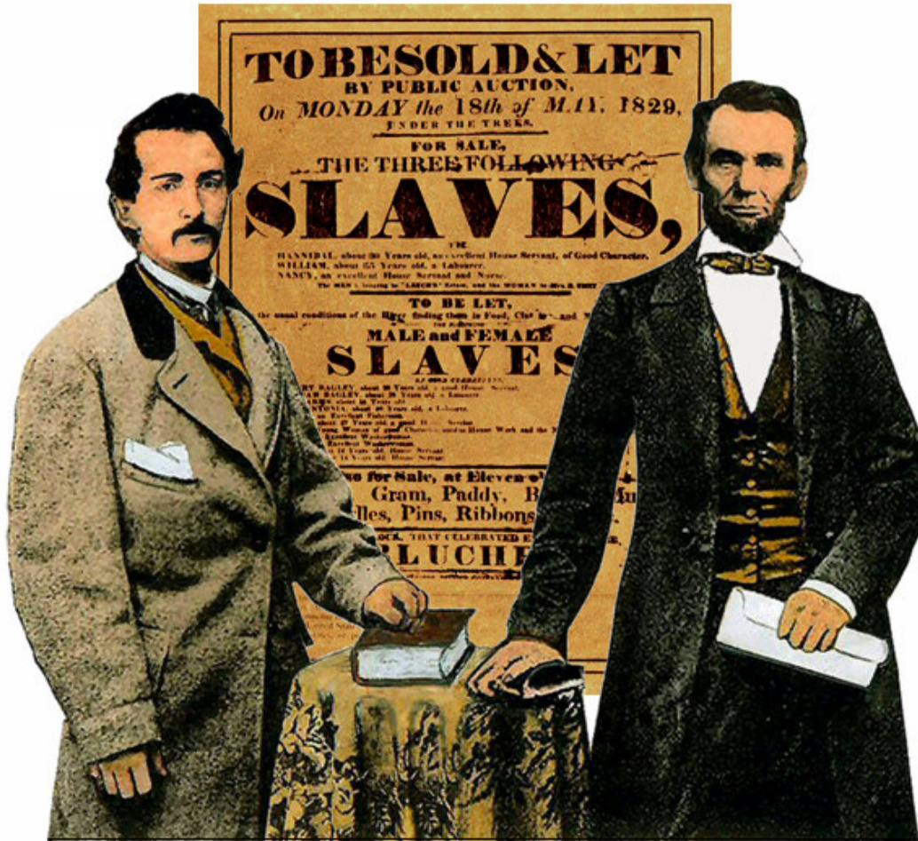
Raccord de deux photos identiques sur un fond symbolique. Booth et Lincoln auraient apparemment posé dans le même studio de photographie, s'appuyant sur la même table recouverte de la même nappe. (C. Hawker - Noireaux)